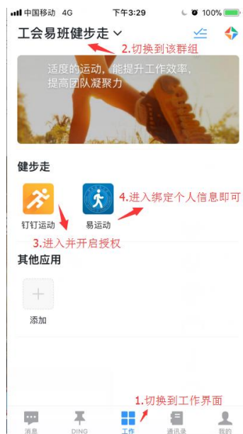
切换到工作台流程